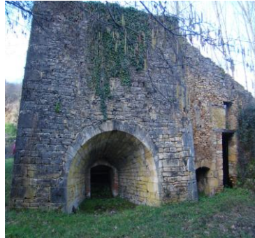
Le haut fourneau d'affinage