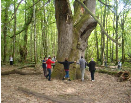
Châtaignier de 8 m de circonférence

Un groupe d'une quarantaine de personnes, adhérents, sympathisants, amis, famille, s'est formé à 9h30 en un cortège de onze voitures à la découverte des plus vieux châtaigniers de St Cernin de l'Herm, puis de la forge de la mouline toute proche, du Dolmen de Besse « dit Roc Travers » et du chêne vert tricentenaire près du château.