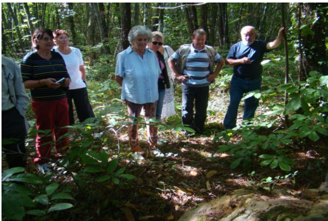
Moment de recueillement (non improvisé !)