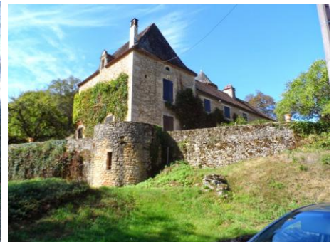
La maison du « Maître des Forges »