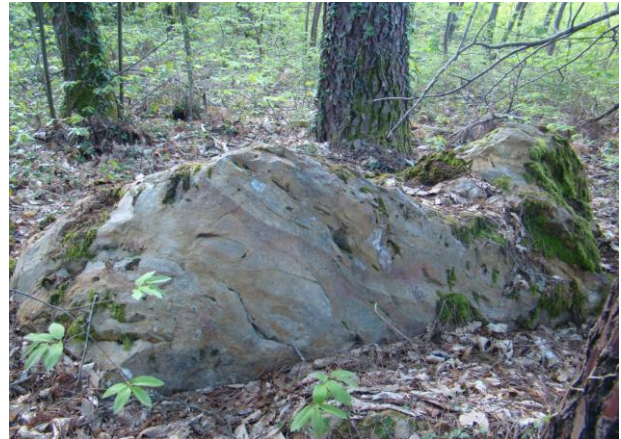
devant le Dolmen de Besse « dit Roc Travers » (Table affaissée).

Il était près de 13 h et les estomacs grondaient. Nous nous regroupâmes dans la peupleraie, derrière la Mairie de Besse pour un petit apéritif bien mérité et nous piqueniquâmes.