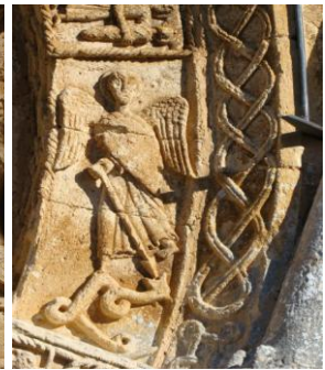
St Michel et le Dragon