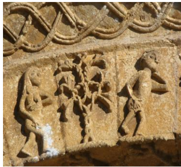
Adam et Eve