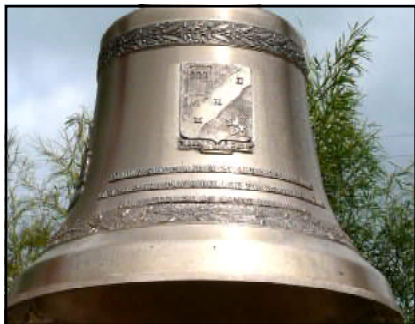
La nòva campana La nouvelle cloche (2009)