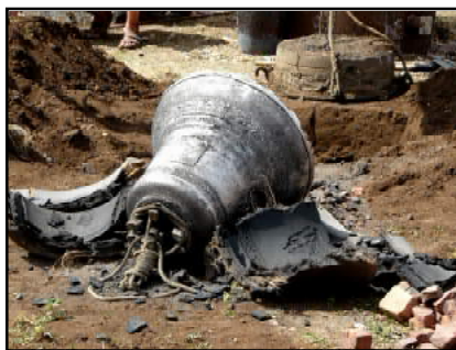
La campana sortida del monle La cloche sortant du moule (2008)