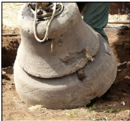
Lo monle a Sent Albin de Lencais Le moule à Saint-Aubin-de-Lanquais (2008)

Désormais, trois cloches carillonnent au clocher de Conne-de-Labarde !