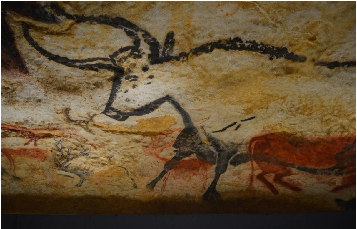
Découverte du Fac-Similé « Lascaux IV » « La Chapelle sextine de la préhistoire »