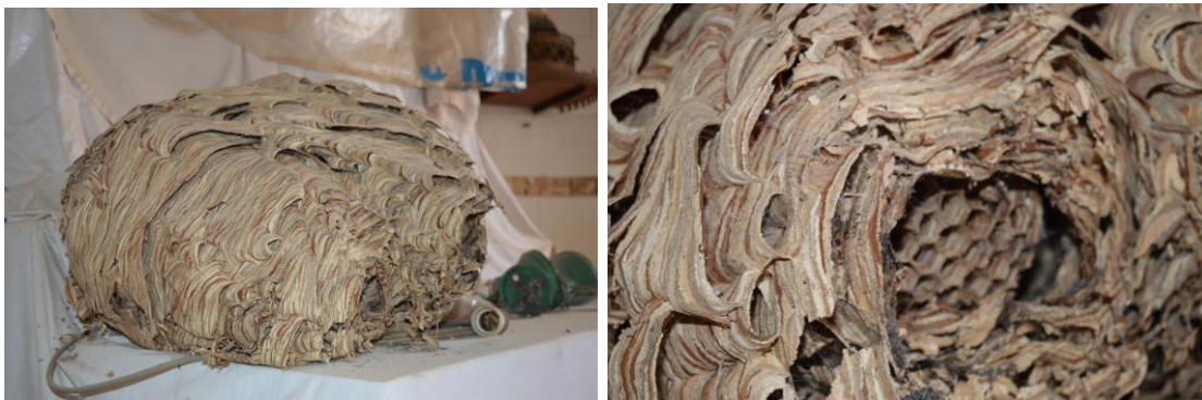
Nids de Frelons asiatiques