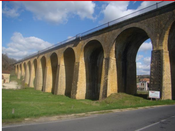
Viaduc ferroviaire de Belvès (1843)