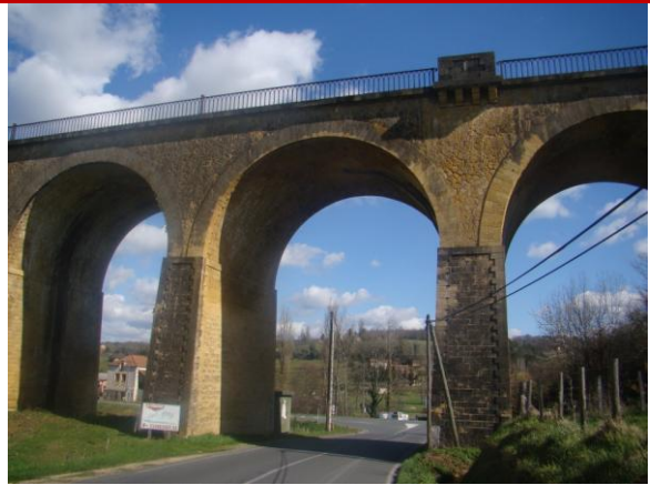
Bel ouvrage d'art en pierre de taille