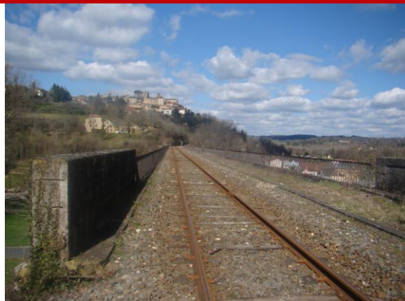
Viaduc droit, voie unique sans dévers