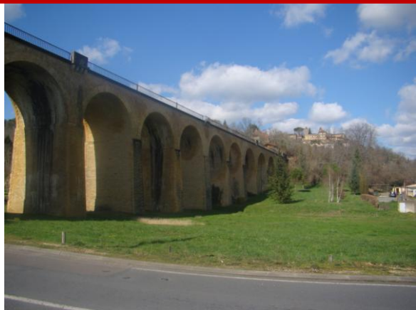
Belvès(24) en arrière plan